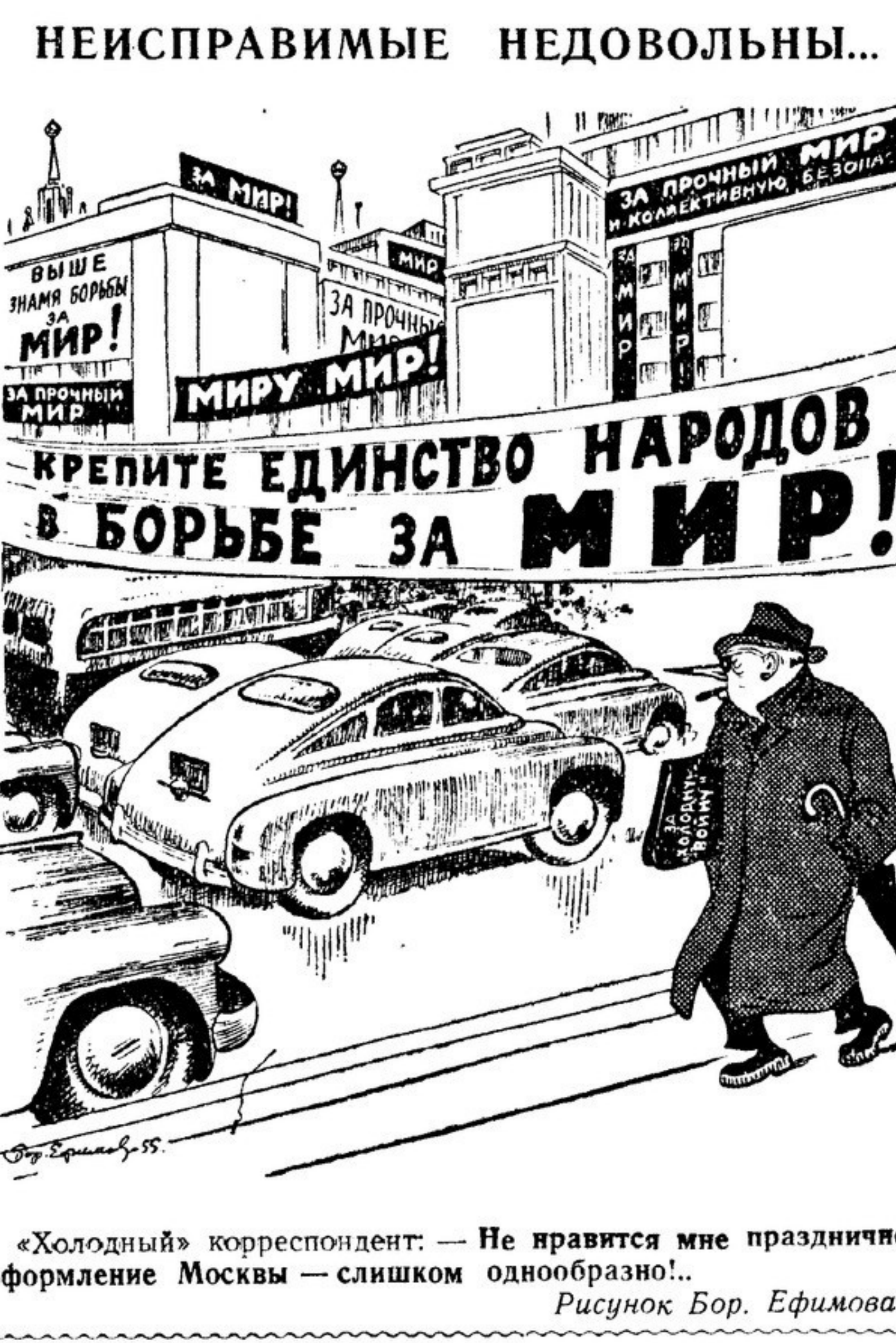
«Холодный» корреспондент. — Не нравится мне праздничное оформление Москвы — слишком однообразно! Рисунок Бор. Ефимова